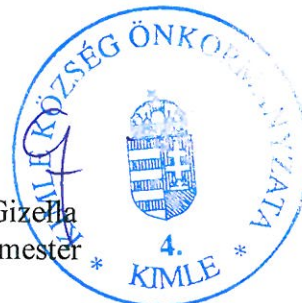
Eller Gizella polgármester