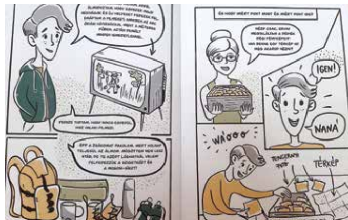
Beszámolót összeállította: Susovits Vera