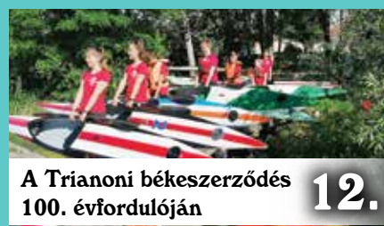
A Trianoni békeszerződés 100. évfordulóján