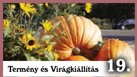
Termény és Virágkiállítás