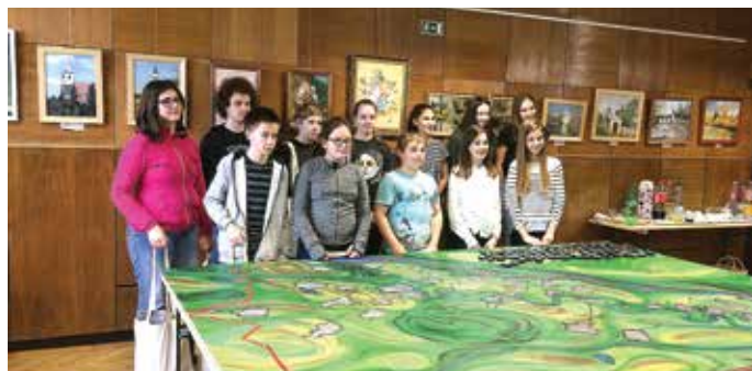
Térségi versenyen a terepasztal volt a legnépszerűbb állomás

Májusban térségi natúrparki vetélkedőt szerveztünk, itt két csapatban is a település diákjai versenyeztek. Az egyik csapat az országos döntőbe továbbjutva Hollókőn tölthetett 2 mozgalmas, barátkozós napot az ország 10 másik natúrparki térség gyermekeivel.