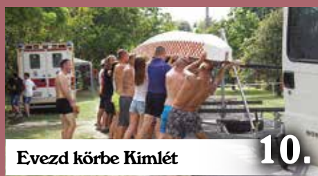
Evezd körbe Kimlét

kialakítását az egykori iskolában, a sportpályán futókör és fitness park építését és az 1900-as évek elején épült községháza felújítását. A sportpályán zajló beruházások már lezárultak, azt már egy éve birtokba is vették a falu lakói, az iskola diákjai és sportkör tagjai. Ezúttal a régi községháza épületén végzett munkálatok zárultak le, ahol nyílászáró cserét, tetőszerkezet javítást végeztek, szigeteltek, udvart rendeztek és csónaktárolót építettek. Az épületegyüttes Duna parti oldalán ugyanis csónakház működik a Kimlei Sárkányhajó Vízisport Egyesület székhelyeként folytatás a 2. oldalon