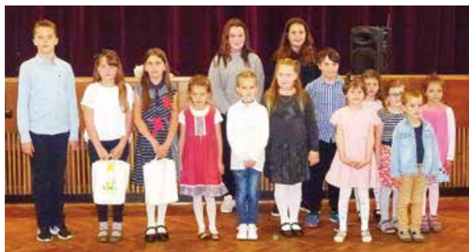
Anyák napi rajz- és versíró verseny díjátadója

2019 tavaszát a hagyományossá vált Anyák napi rajz- és versíró verseny színesítette. A díjazottak között kimlei iskolásokat és óvodásokat is köszönthettünk.