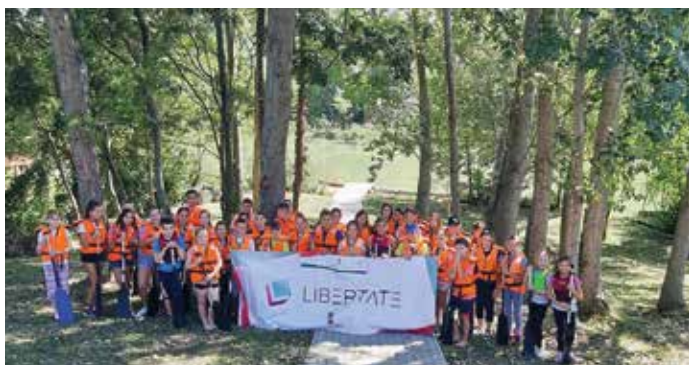
Szlovákiai magyar gyerekek élménye a Mosoni-Duna partján

A bolgárok mellett Szlovákiából is érkeztek hozzánk vendégek a térség megismerésére. A délután folyamán a Kimlei Sárkányhajó Egyesület kormányosai tették felejthetlenné a felsős tanulók „ökonapját”. Az 50 fős csapat megmozgatása nem kis feladat volt. Megismerkedtek a Szigetköz értékeivel, a tanároknak jó gyakorlatot mutattunk a Sudár Birtok (Győrújfalú) bejárásával, a gyógy- és fűszernövényeik megismertetése közben.