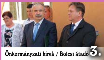
Önkormányzati hírek / Bölcsi átadó 3.