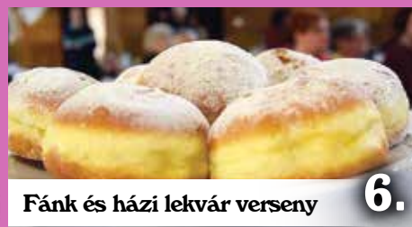
Fánk és házi lekvár verseny 6.