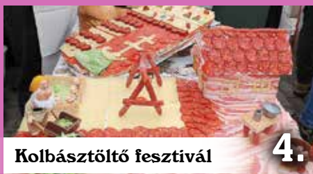
Kolbásztöltő fesztivál 4.